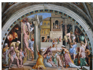
LAS ESTANCIAS DEL VATICANO El incendio del Borgo Museos Vaticanos, Ciudad del Vaticano