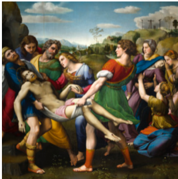
ENCONTRAR EL EQUILIBRIO La deposición (El Traslado del Cristo al Sepulcro) Galería Borghese, Roma