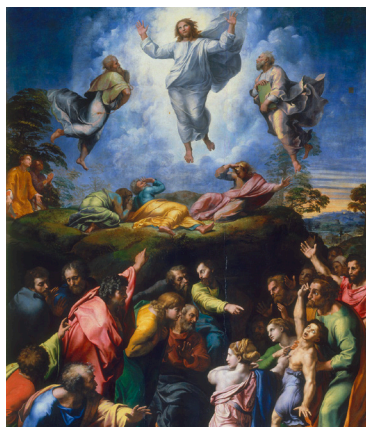
LA UTOPIA Y EL PODER La transfiguración Pinacoteca Vaticana, Ciudad del Vaticano