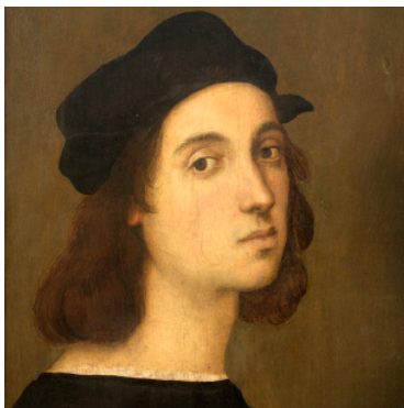
A UNIQUE ARTIST | THE FABULOUS YOUNG MAN Autorretrato Galería de los Uffizi, Florencia

Las principales obras de Raffaello en torno a las cuales se desarrollan las áreas temáticas de la exposición.