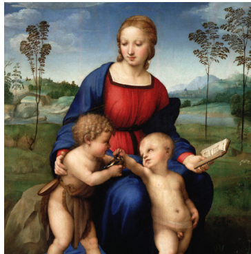
THE NOBLE SPIRITUALITY La Virgen del jilguero Galería de los Uffizi, Florencia