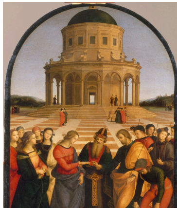
HABITAR EL ESPACIO Los desposorios de la Virgen Pinacoteca di Brera, Milán