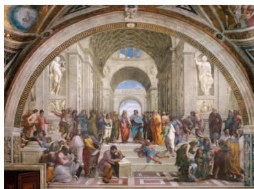
LAS ESTANCIAS DEL VATICANO La escuela de Atenas Museos Vaticanos, Ciudad del Vaticano